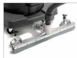
SUCEUR FIXE EN OPTION